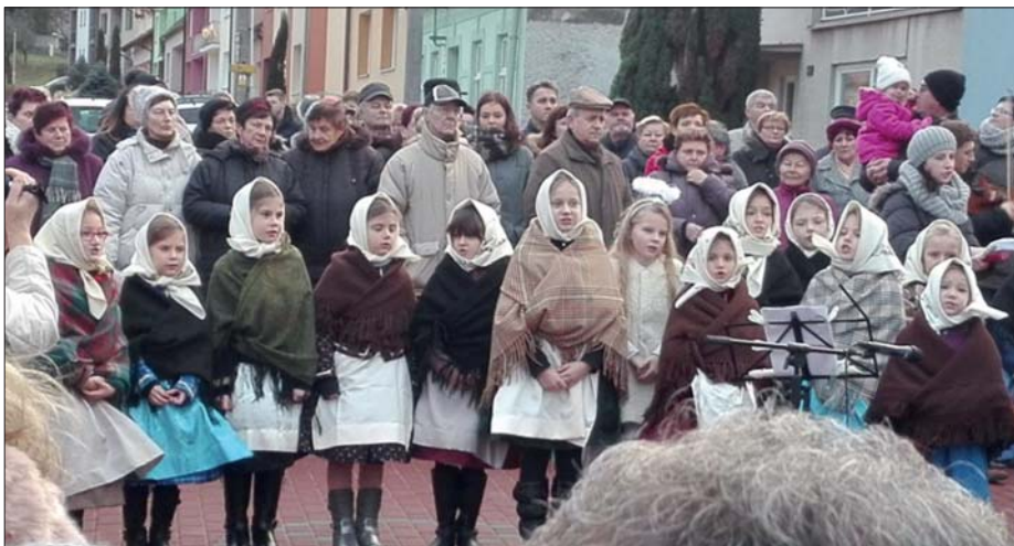
Lohovecké děti, Vánoční zpívání u obecního stromu 2018

Momentálně má soubor Lohovecké děti dvě varianty krojů – letní a zimní. Rozdíl v krojích je také podle věku dětí. Dívky 4 – 5ti letě oblékají takzvanou pasnicu, tady v Hlohovci známou spíše pod názvem kaboš. Jedná se o spojené šaty, které jsou spíše delší, zdobené sámkou nebo kraječkami. Pasnicu /kaboš oblékají dívky v létě i v zimě. Letní varianta dívek ve věku 6 – 7 let sestává z plátěné sukýnky a bílé plátěné košilky. Sukýnka je buďto červená s bílým potiskem nebo tmavě modrá s potiskem – ve vzhledu modrotisku, který v našem regionu býval tradiční. Košilka je jednoduchá, neškrobená, se spuštěným rukávem k lokti, pouze jemně zdobená. Starší dívky mají již takzvané šaty, tzn. jupku a sukni s jednou neškrobenou spodničkou. Barvy šatů jsou voleny do