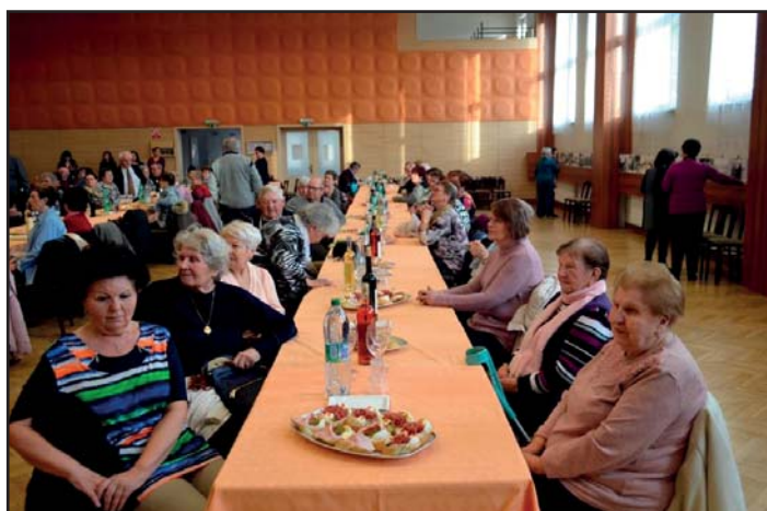
Setkání seniorů v KD.