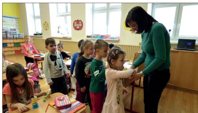
Paní učitelka ve škole nás pěkně přivítala

počítáři nebo jak krásně jim jde čtení. Do veškerého dění paní učitelka zapojovala i předškoláky. A ti si tak mohli vyzkoušet co je v příštím roce čeká. Na závěr se děti spolu pohrály na koberci, nakreslily si na památku obrázky a předaly si drobné dárečky. Pro všechny děti to bylo dopoledne plné radostných setkání. A pro předškoláky další impuls k většímu těšení se na zápis do 1. třídy, který je čeká již brzy a to 2. 5. 2019. Všem předškolákům i školákům přejeme spoustu radosti z učení!