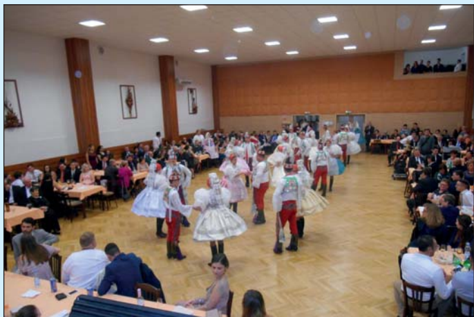
Slavnostní předtančení Moravské besedy

Text i foto: Stárci Jan Schallenger a Karel Vlašic