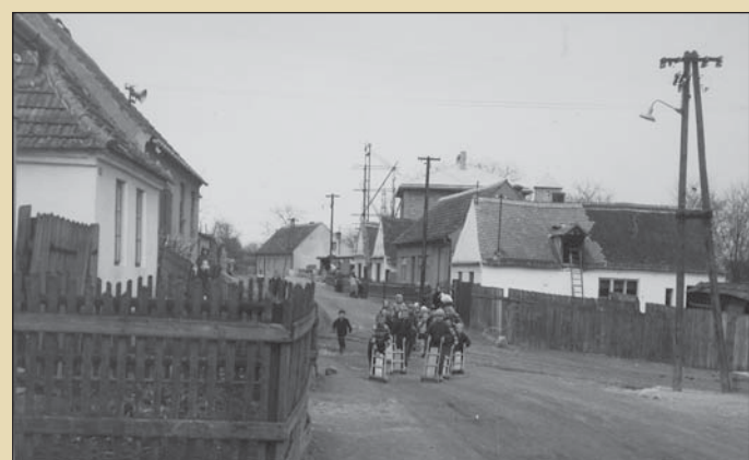
Hlavní ulice, r. 1961