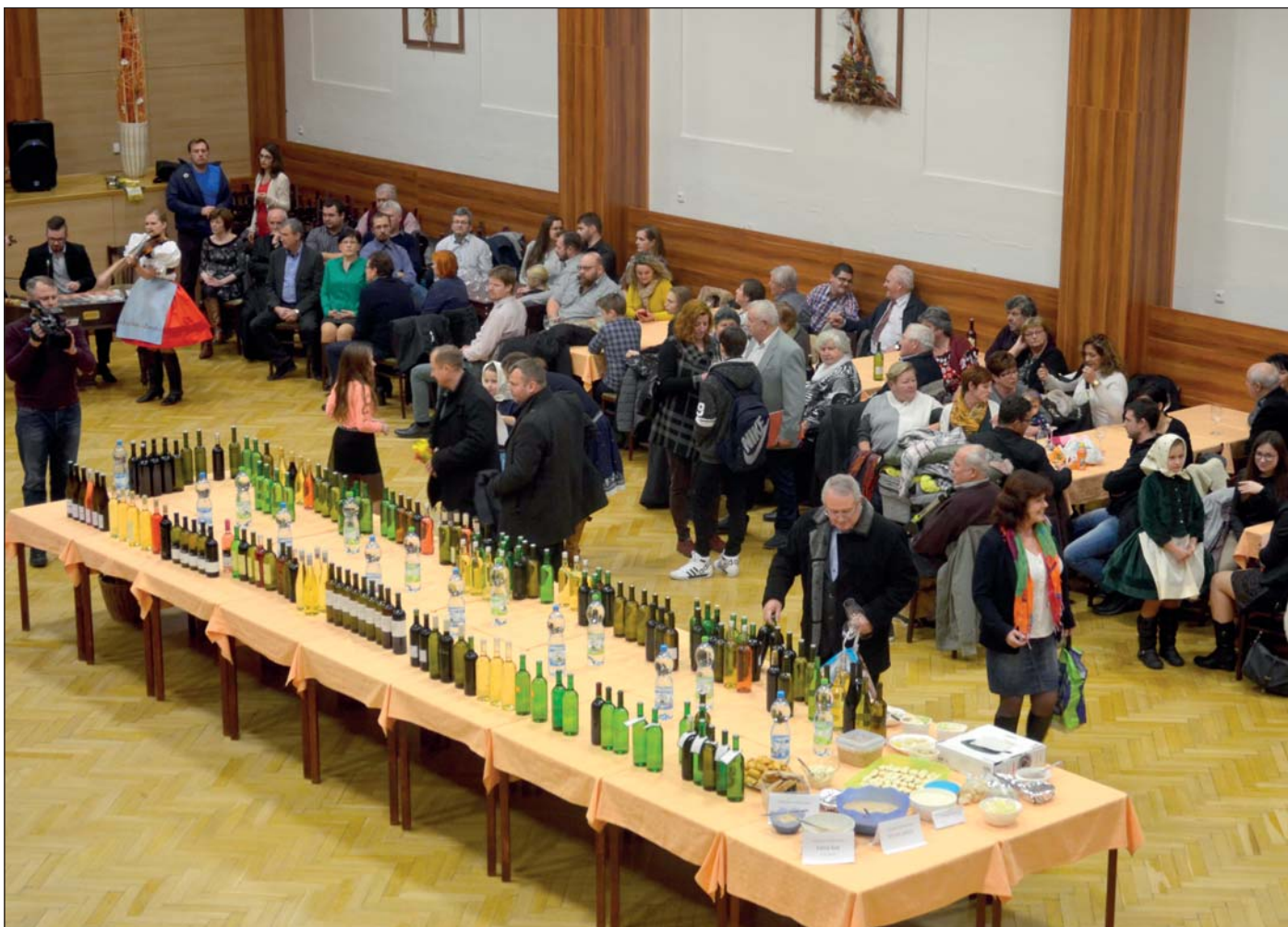
Svěcení mladých vín v KD