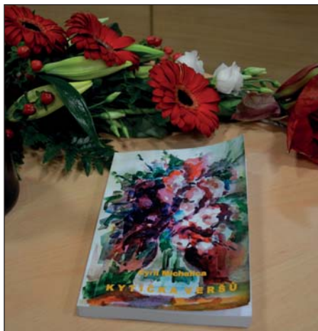
Kniha Kytička veršů