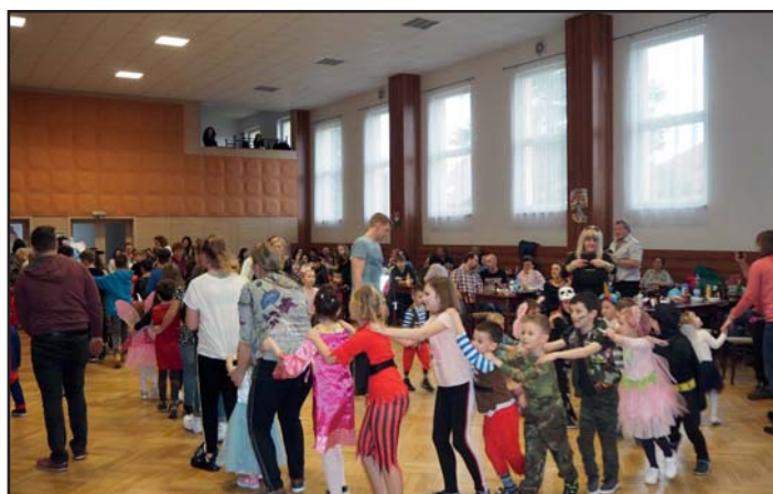
Dětský karneval, rej masek.