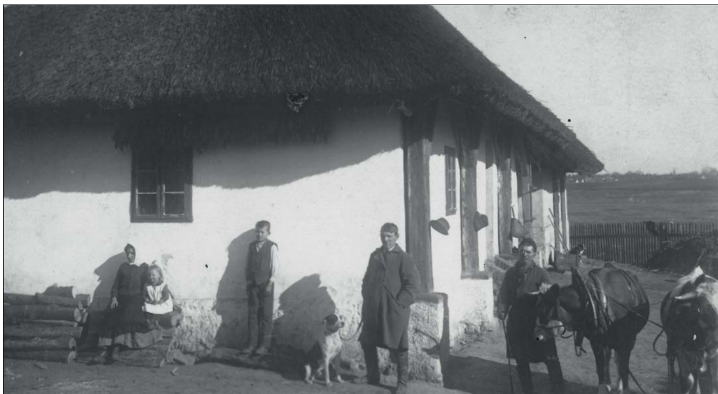
Dobová fotografie Hlohovce.