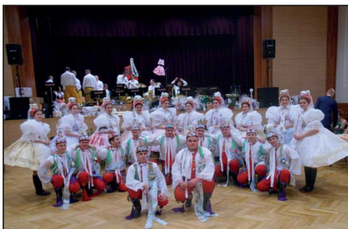
Krojový ples 2018.