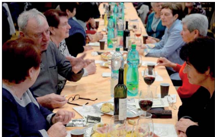
V sále byla příjemná atmosféra