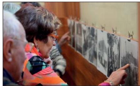
Výstava byla instalována na panelech v KD.