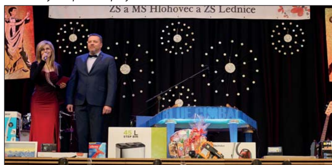
Zahájení 12. Reprezentačního školního plesu