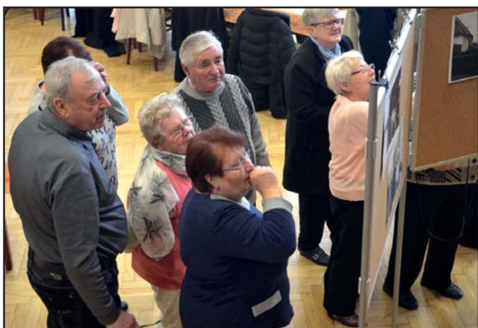
Setkání seniorů, prohlídka fotografií.