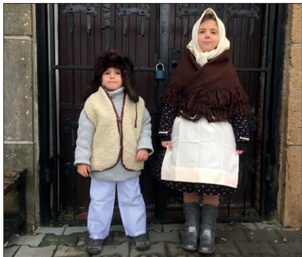
Chlapec a děvče v novém kroji