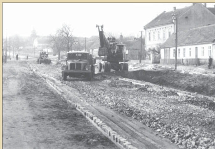
Dědina - budování silnice