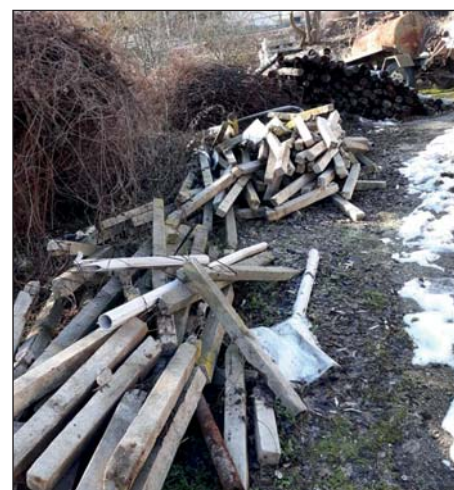
Úklid v areálu zemědělského družstva