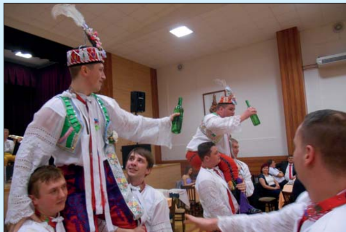
Volba nových stárků