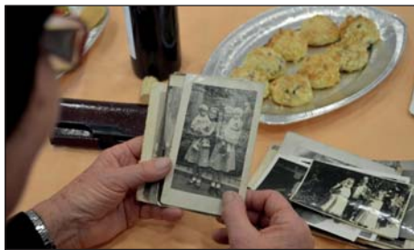
Prohlídka dobových fotografií