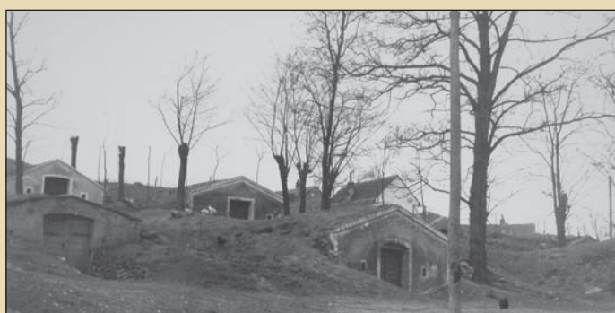
Hlohovecké sklepy, r. 1965