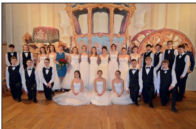
Absolventi ZŠ Hlohovec na 12. školním plese.