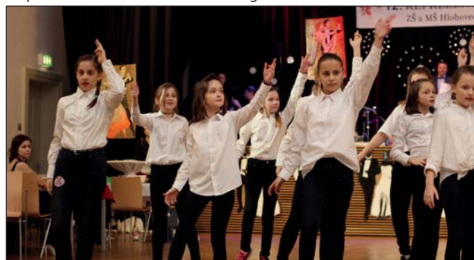
Taneční vystoupení skupiny N.C.O.D.