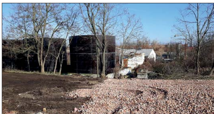
Celý areál ZD je nutno udržovat