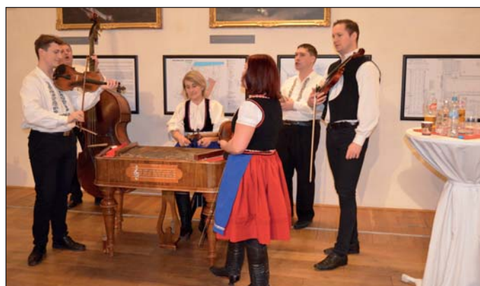
Na plesu zahrála hlohovecká CM Longa