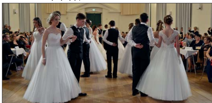
Slavnostní polonéza v podání žáků 8. a 9. ročníku