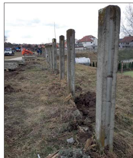
Posprejované betonové zdi hyzdily prostor hřiště i jeho okolí