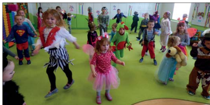
Fašankové veselí ve školce