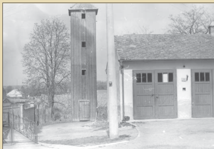
Hasičárna, dům č.p. 107