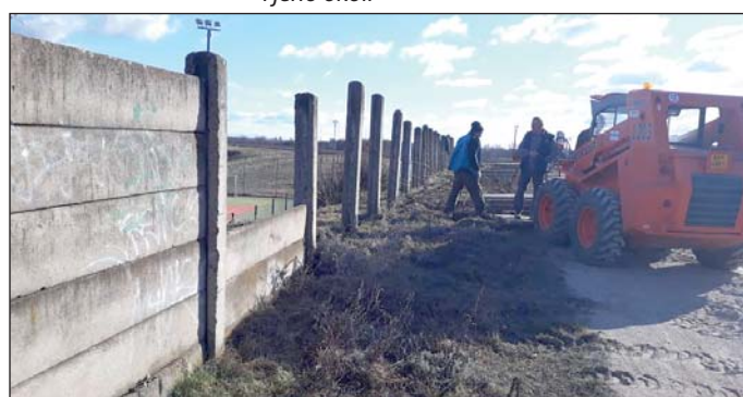
Demontáž oplocení kolem sportovního areálu