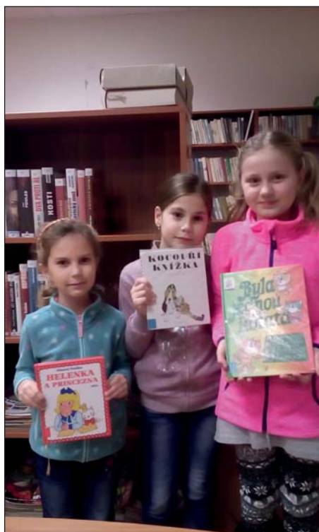
Nabídka knih pro děti je pestrá

Březen je tradičně označován jako měsíc všech čtenářů a čtenářek. Pravidelně pořádané celorepublikové akce v rámci tohoto měsíce si každoročně kladou za cíl vyzdvihnout společenský význam četby a zvýšit její atraktivitu, propagovat činnost knihoven a informačních center mezi širokou veřejností, zvýšit zájem o služby knihovnických zařízení a vzájemně propojit nejen čtenáře a nejrůznější instituce zabývající se fenoménem čtenářství, ale i ty, kteří si k četbě svou cestu teprve hledají.