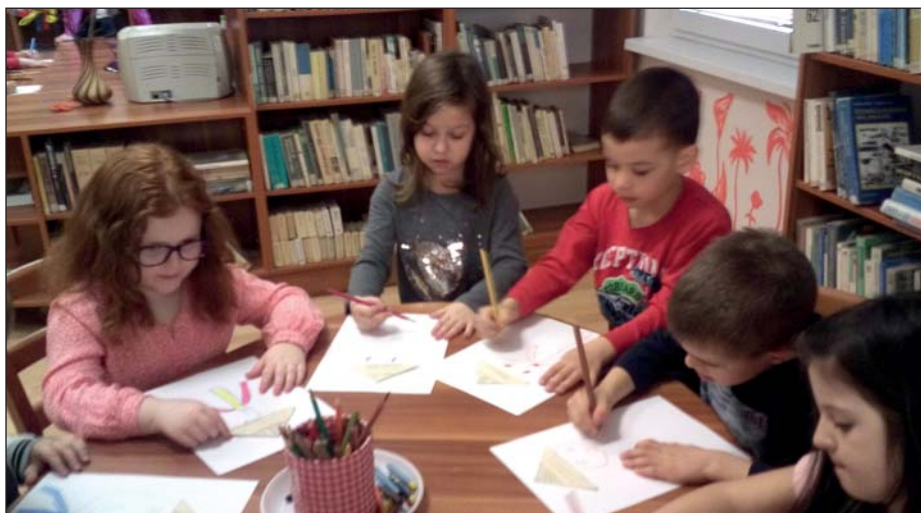
Žáci základní školy se zúčastnili programu v knihovně