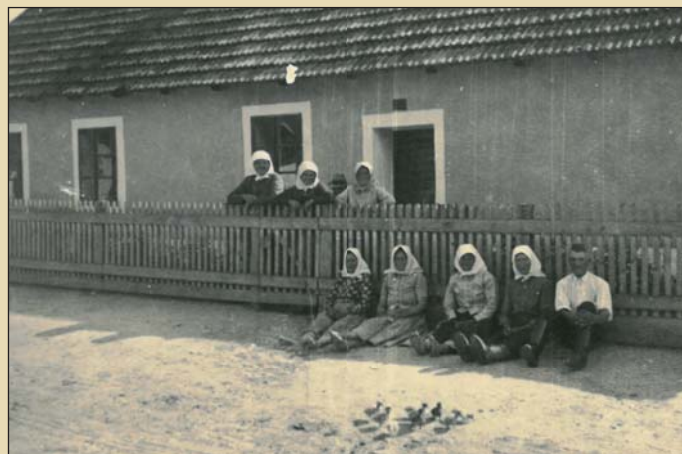
Ženy před chalupů