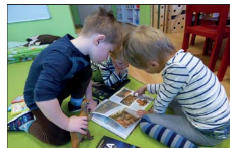
V knihách se dozvíme spoustu nových věcí.