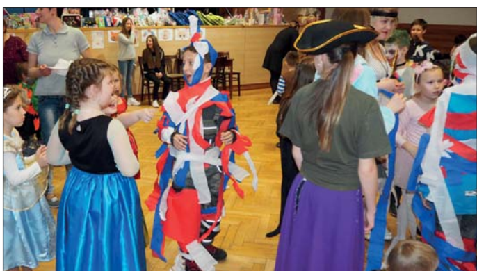
V kreativní soutěži vytvářely děti oděv v národních barvách