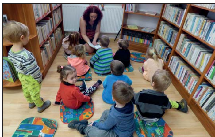
MŠ na návštěvě v knihovně.