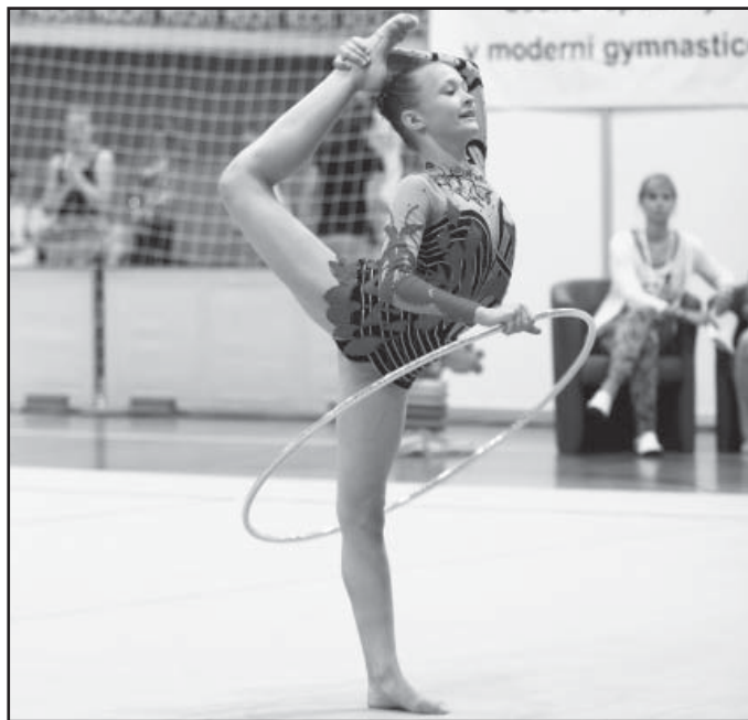
Soutěžní vystoupení, sestava s obručí