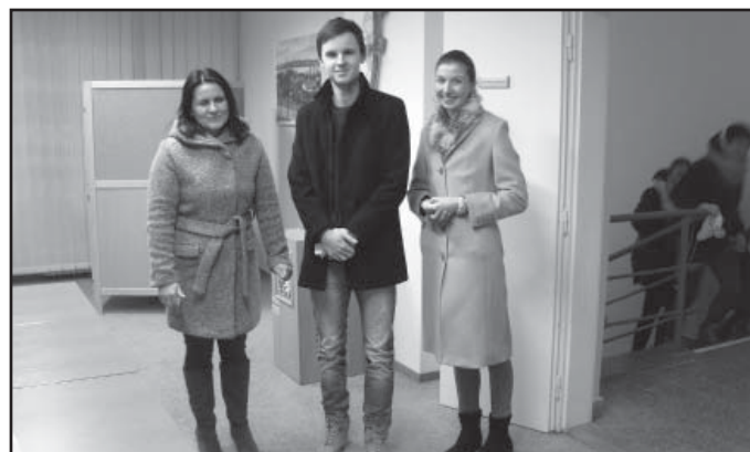
Mladí prezidenta volili poprvé