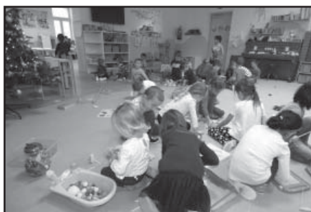
Radost z nových dáreků...