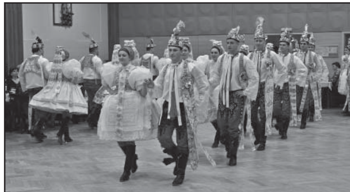
Krojový ples, průvod