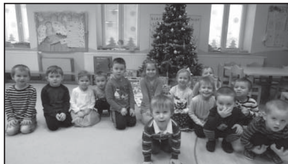
Byl u nás Ježíšek!