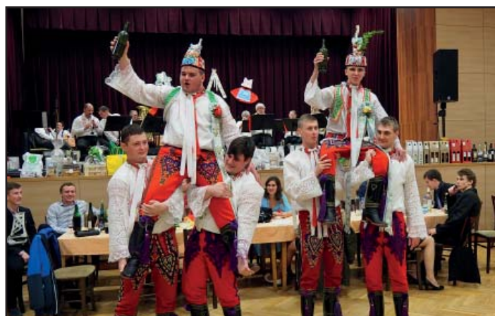
Krojový ples, volba nových stárků.