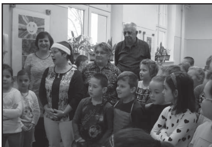
Den umění v ZŠ, přivítání hostů.