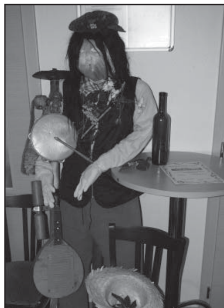
Postava Lohovčana vítala hosty akce.