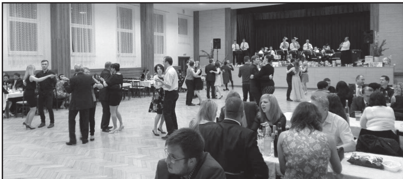
Myslivecký večer, ve víru tance