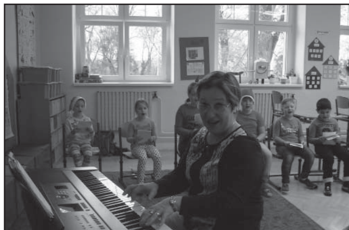
Hudební dílna pod vedením J. Pařízkové