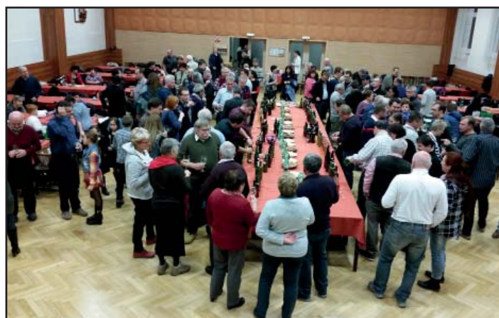
Svěcení vína.