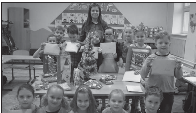
Třídní besídka ve 2. třídě