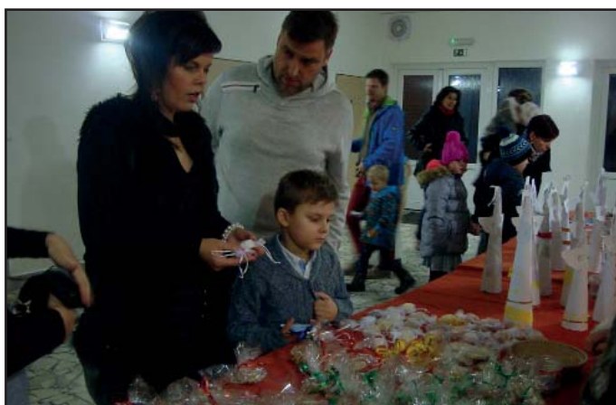
Malý vánoční jarmark v KD.