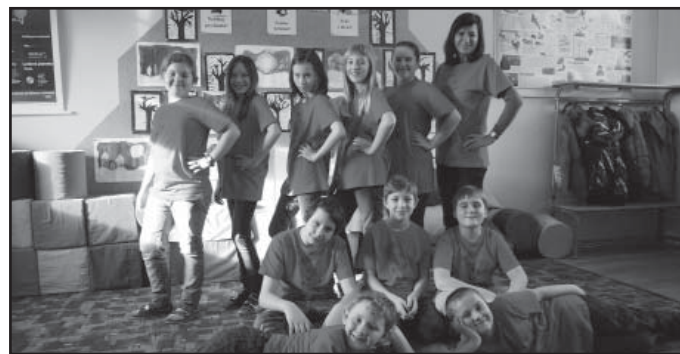
Žákům 5. třídy naložil Ježíšek absolventská trička