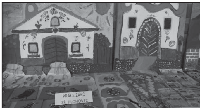
Výstavka prací žáků ZŠ