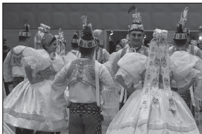
Předtančení České besedy.