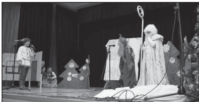
Vánoční besídka, pohádka Mrazík v podání žáků 4. třídy