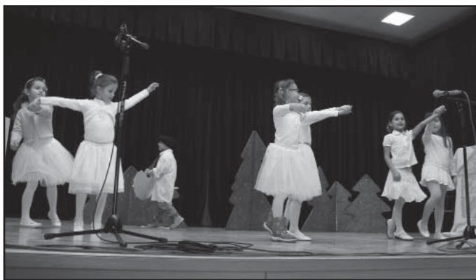
Tanec sněhových vloček, 1. třída