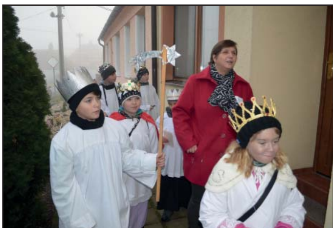
Tříkrálová sbírka, jedna ze čtyř skupin koledníků.