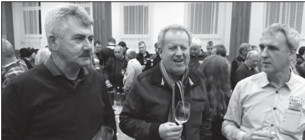
Svěcení vína, tři koštěři