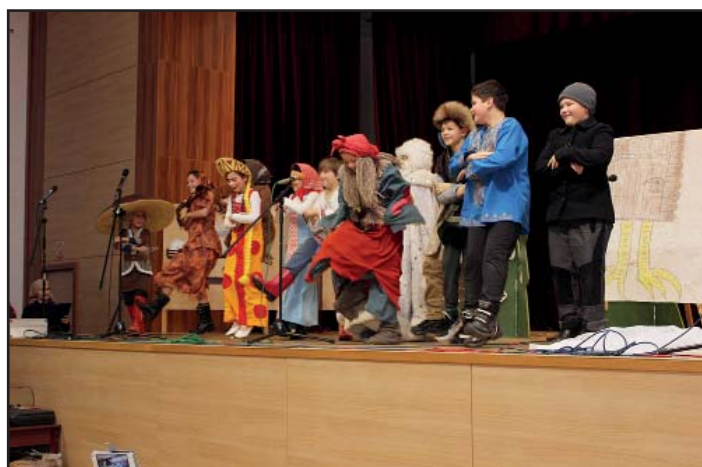
Vánoční besídka žáků ZŠ, pohádka Mrázík.