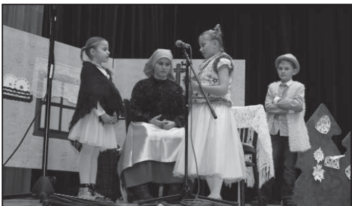
O dvanácti měsíčkách, pohádka v podání žáků 2. a 5. třídy