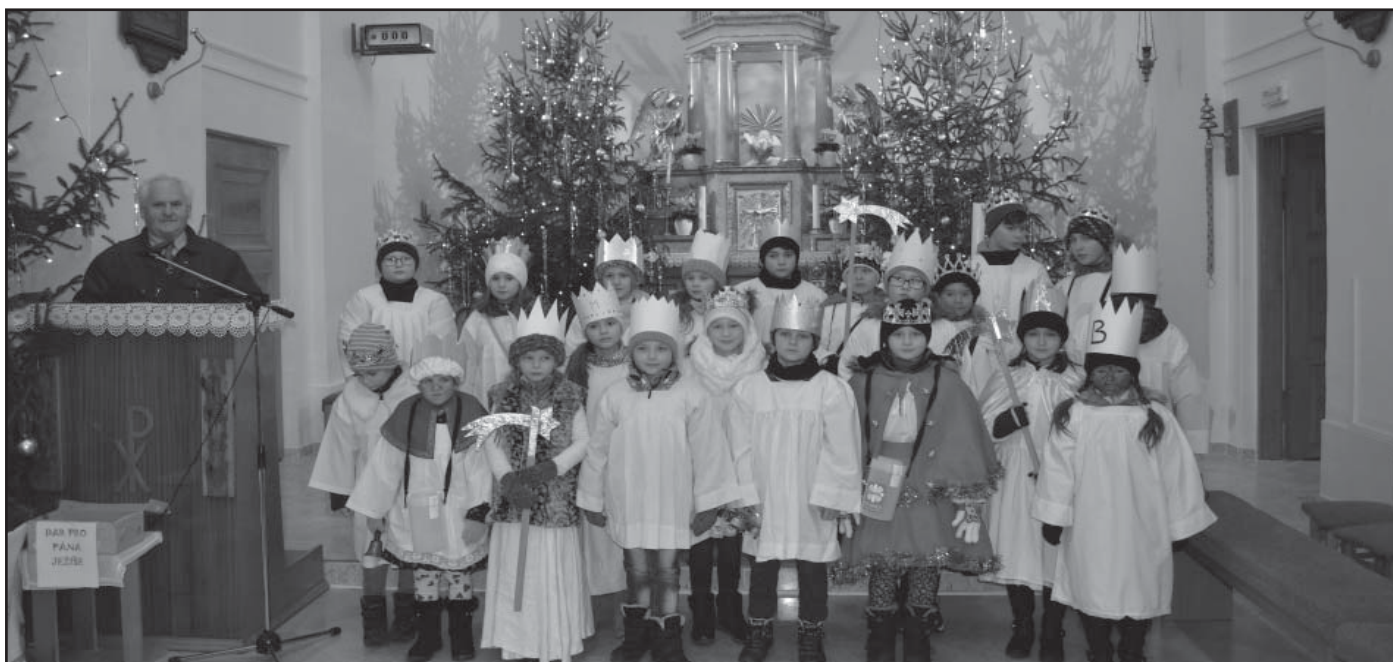
Tříkrálová sbírka, sraz koledníků je tradičně v kostele