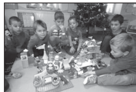
Nové lego pod stroměčkem