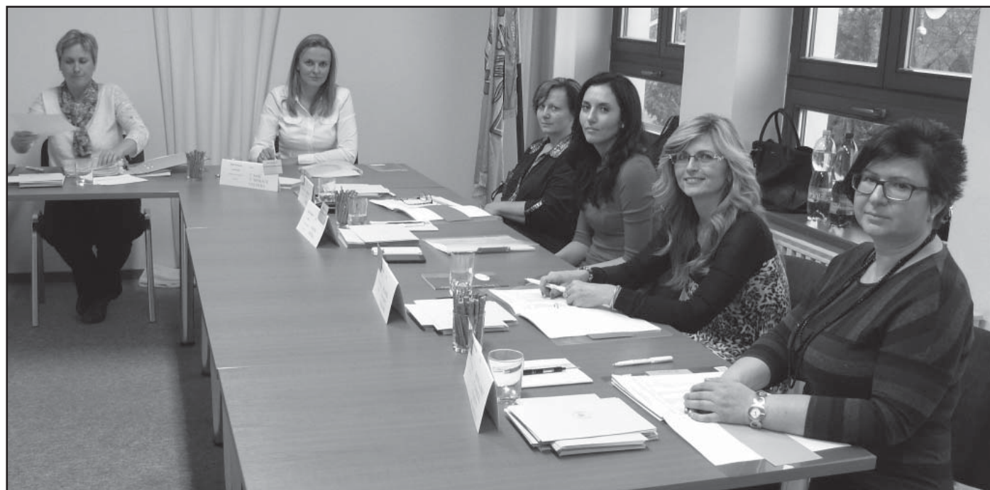
Volby prezidenta 2018, volební komise v Hlohovci