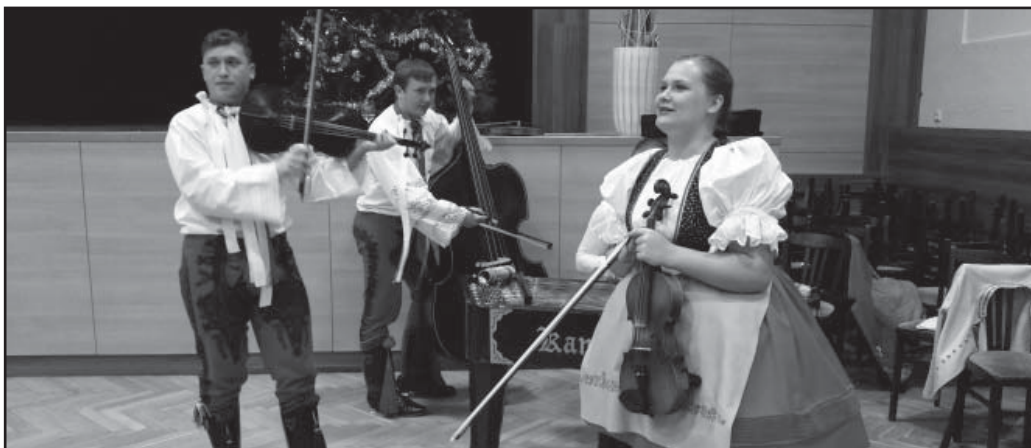
Svěcení vína, CM Kamenica