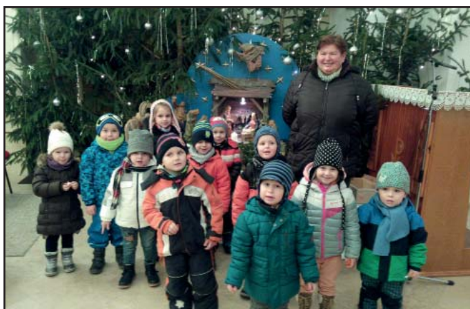
Děti při prohlídce betléma v našem kostele.