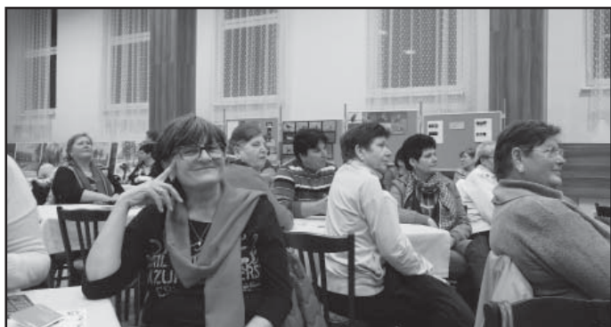
Sál KD byl zcela zaplněn diváky