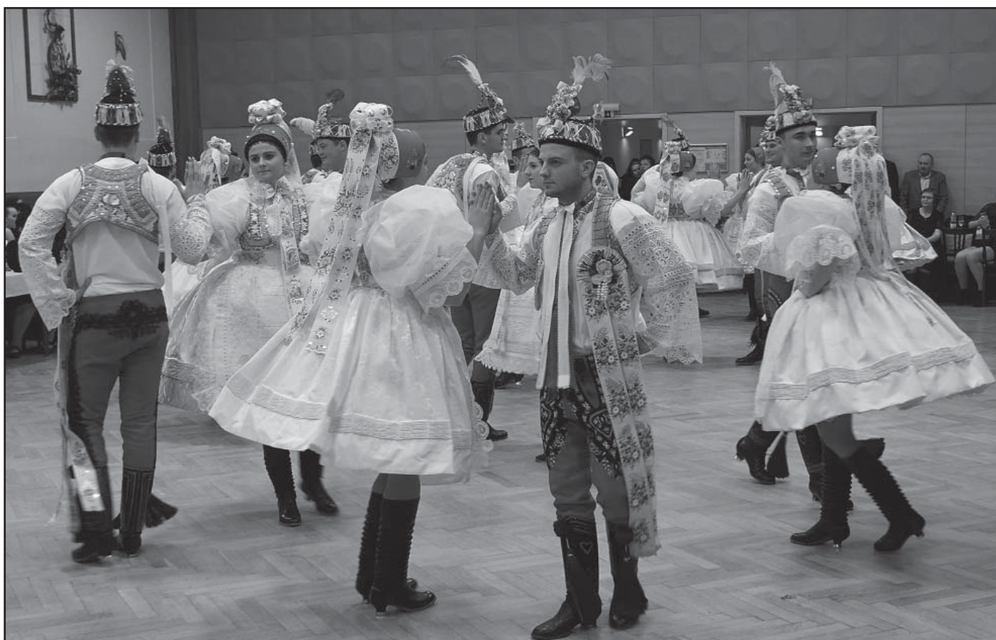
Krojový ples, Česká beseda