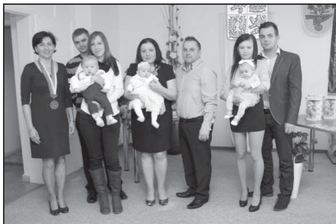
Vítání občánků, paní starostka se 2. skupinou dětí a rodičů.