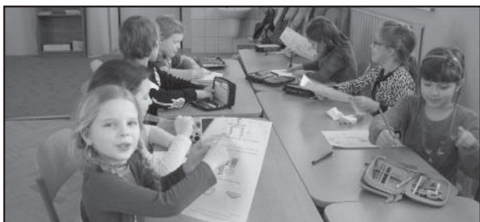
Aktivity klubů děti baví