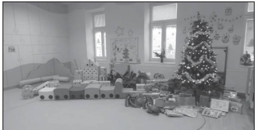
Vánoční nadílka ve školce