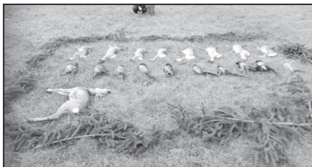
Výřad, hlavní hon 10. 12. 2016