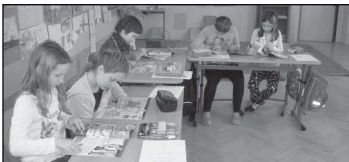
Činnost čtenářského klubu