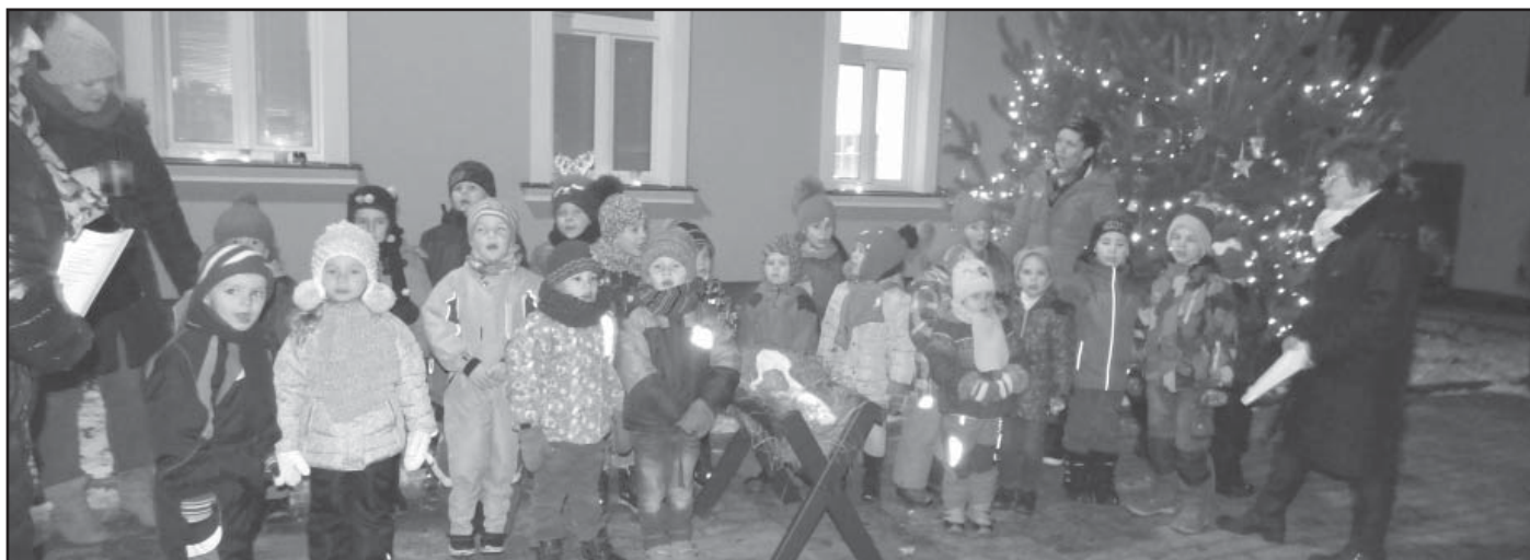
Vánoční zpívání našich nejmenších