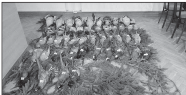
Zvěřinová tombola, Myslivecký večer 19. 11. 2016