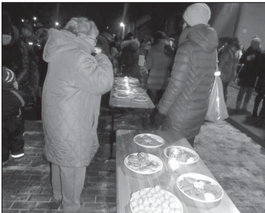
Výběr různých dobrot

V pondělí 19. 12. přišel „Ten Den.“ Napadl sníh a ráno se ve třídě sluníček rozzářil vánoční stromček a pod ním bohatá nadílka dárků. Celé dopoledne děti rozbalovaly a hrály si s novými hračkami a sestavovaly vozidla z atraktivní dřevěné Polikarpovy stavebnice. Samozřejmě, že se zpívaly koledy a nechýběla ani hostina.