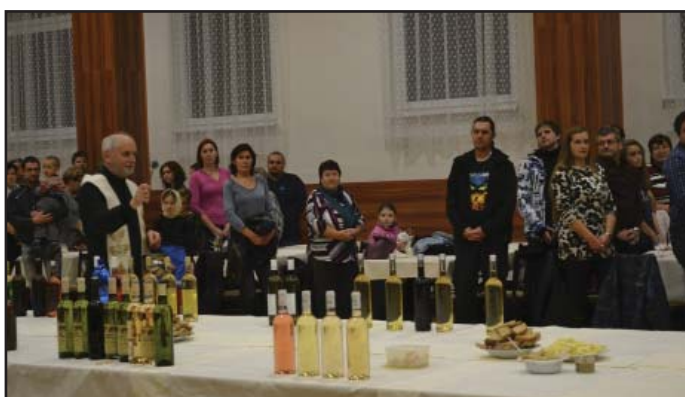
Svěcení vína, prosinec 2016