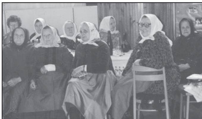
Výroční schůze JZD, rok 1985