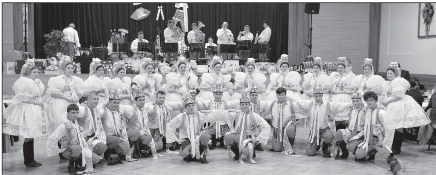
Krojovaná chasa.