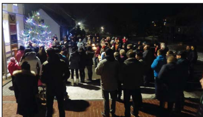
Společné zpívání u vánočního stromu před MŠ za velké účasti občanů