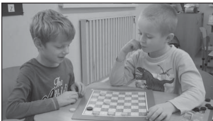
Klub zábavné logiky a her