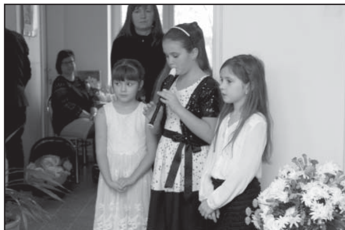
Vystoupení žáků ZŠ Hlohovec.