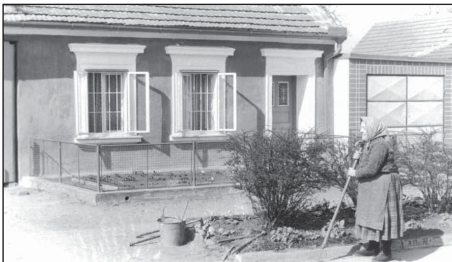
Dům č.p. 15 na ulici Dědina

V 17. století měla obec Hlohovec 39 domů, 9 hospod, kovárnu, v roce 1800 to bylo už 87 usedlostí ( pouze dědina a Dolní Konec).