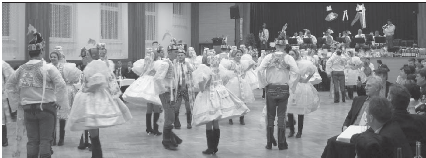
Slavnostní předtančení Moravské besedy.