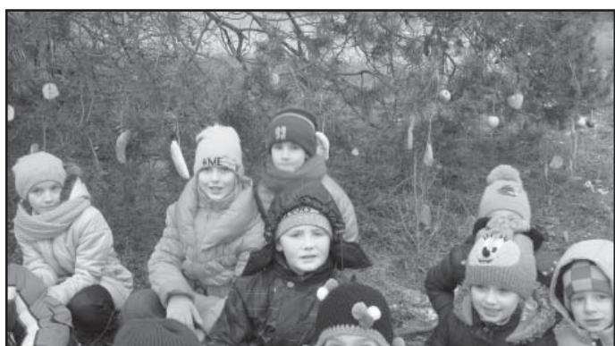
Žáci obdarovali také zvířátka