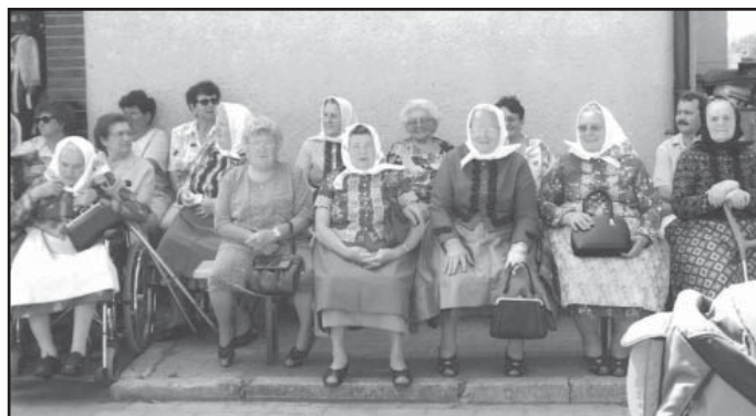
Hodky u kulturního domu v roce 2003