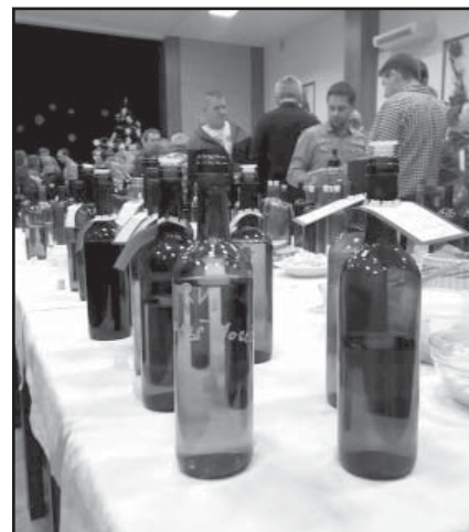
Ochutnávka vzorků i pomazánek