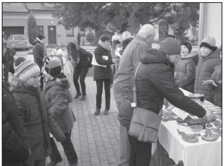
Vánoční jarmark, prodej výrobků dětí a školního časopisu

Advent je nejen časem očekávání, ale také hodnocení. Období adventu je pro většinu z nás časem rekapitulace a zamýšlení se nad průběhem celého uplynulého roku. Je ale také předzvěstí blížících se vánočních svátků, dobrou toužebného a radostného očekávání. Co znamená advent pro naše žáky a jak prožívají konec roku v hlohovecké škole? Adventní období, které začalo „železnou nedělí“, zahájili žáci rozsvícením první adventní svíčky na adventním věnci. Hned úvod adventu patřil Mikulášské nadílce, kterou si pro nás připravili žáci 5. třídy a vtiskli tak do školy duch mikulášských tradic. Na příchod Mikuláše, andělů a čertů se rovněž těšily také všechny děti v mateřské škole. Aby napomohli všichni žáci školy ke slavnostní náladě, naplánovali jsme s našimi dětmi řadu akcí. Začali jsme již 6. prosince, kdy naši malí i velcí žáci přispěli k oživení předvánoční atmosféry. Mikulášská besídka s jarmarkem pro malé i velké proběhla na prostranství před kulturním domem. Připravený program zahrnoval vystoupení žáků školy, následovalo vystoupení dětského lidového souboru Lohovecké děti. K adventního času neodmyslitelně patří vůně vánočního cukroví. Vánoční pečení a zdobení perníčků tak patří k oblíbeným tradicím v naší škole. V předvá-