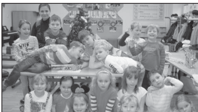
Třídní vánoční besídka v 1. třídě