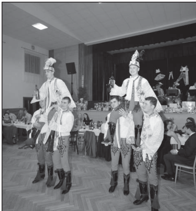
Volba nových stárků.