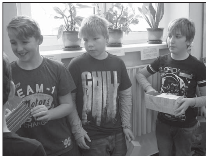
Žáci 5. třídy a jejich nejlepší vynálezy