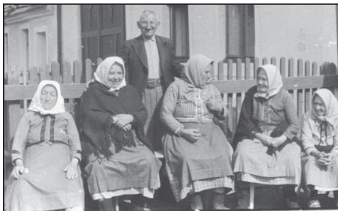
Podvečerní posezení před domem, Chalupky r. 1956