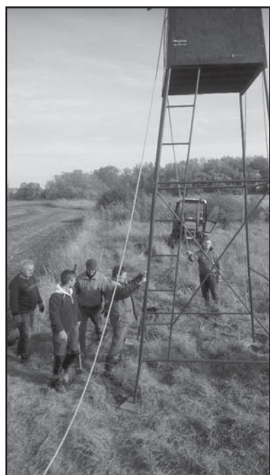
Instalace zrekonstruovaného posedu