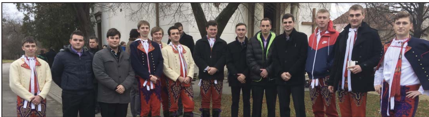
Hlohovecká chasa na sv. Štěpána