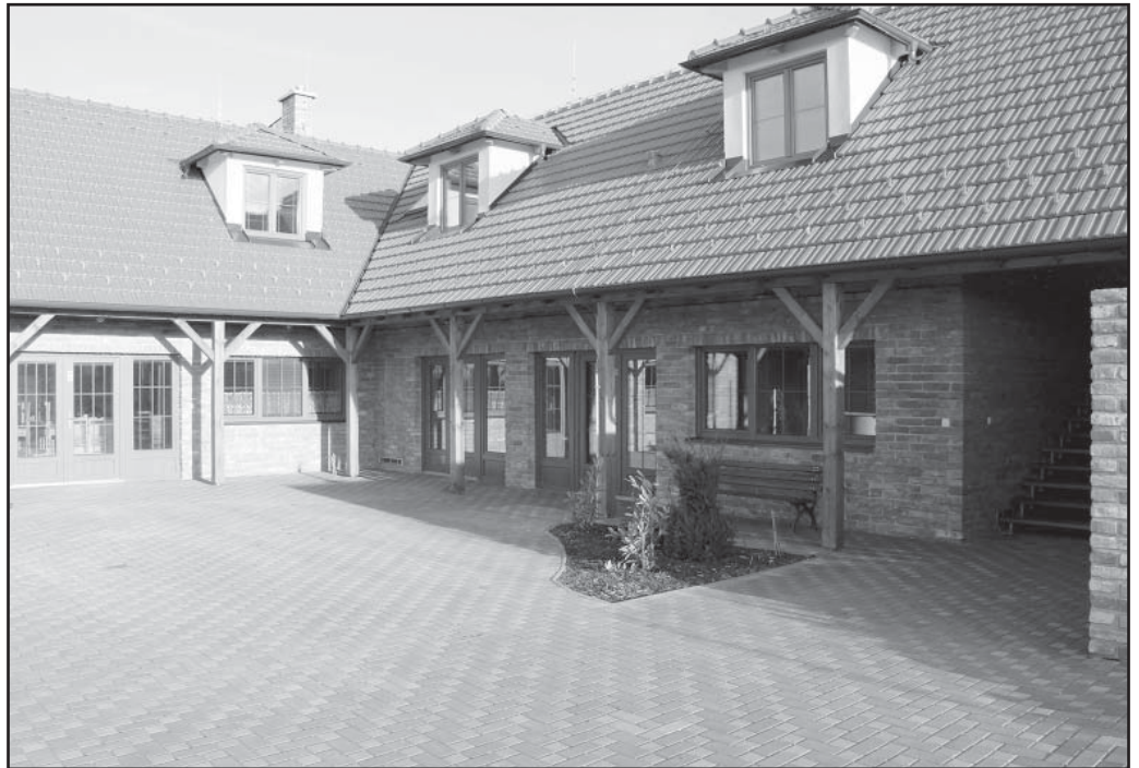
Vinárna a konferenční místnost