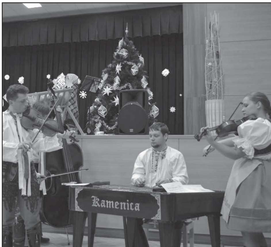
Účinkovala také cimbálová muzika Kamenica

Tak si spolem zaspívajme, nech nám víno šmakuje. Nech nám spolem ve sklépečku, pri vínečku dobre je.