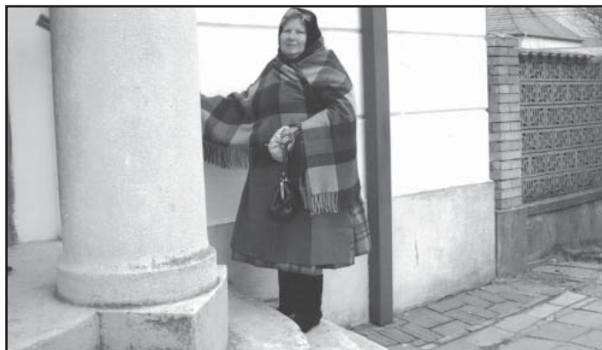
Nejmladší krobůtka před kostelem