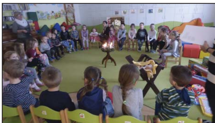
Těšení na dárečky a zpěv koled v MŠ