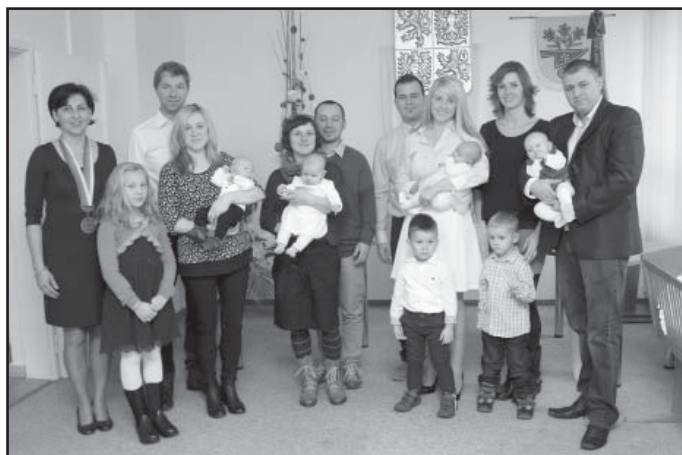
Vítání občánků, 3. skupina dětí a rodičů.