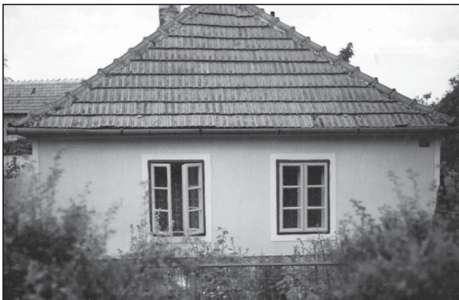
Dřívější podoba staveb v Hlohovci