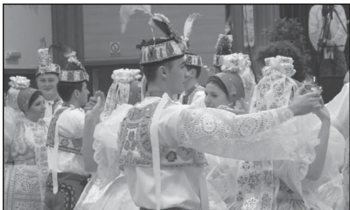
Krása lidových krojů.