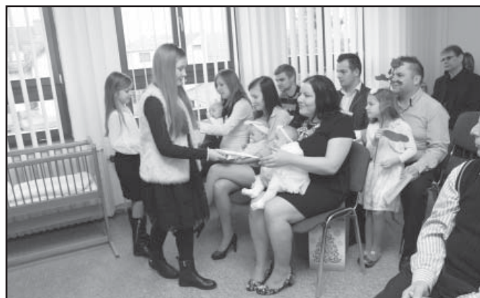
Školní kmotři předávají novorozencům malý dárek.