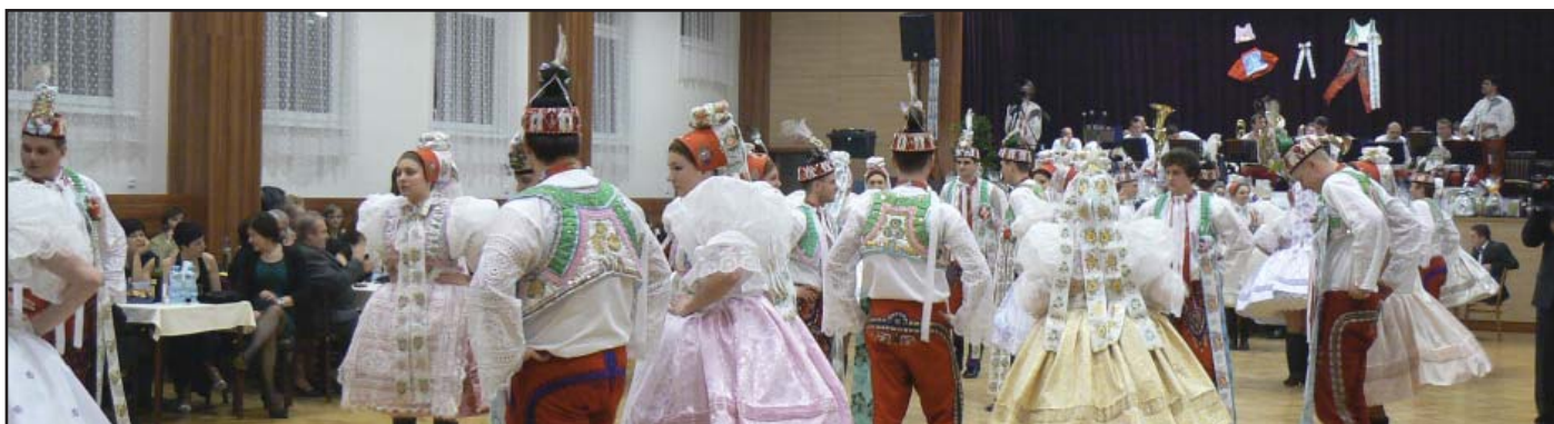
Krojový ples, předtančení Moravské besedy