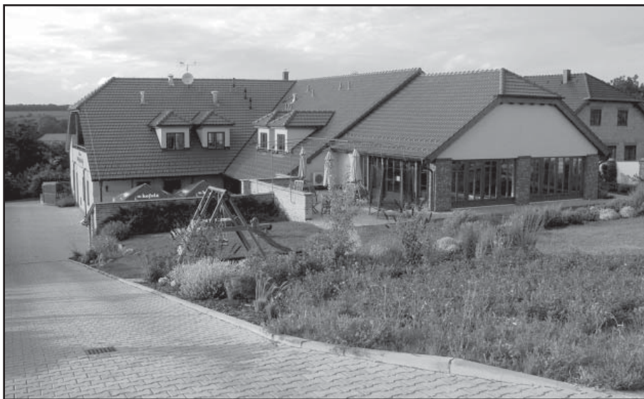
Pohled z dvorní části