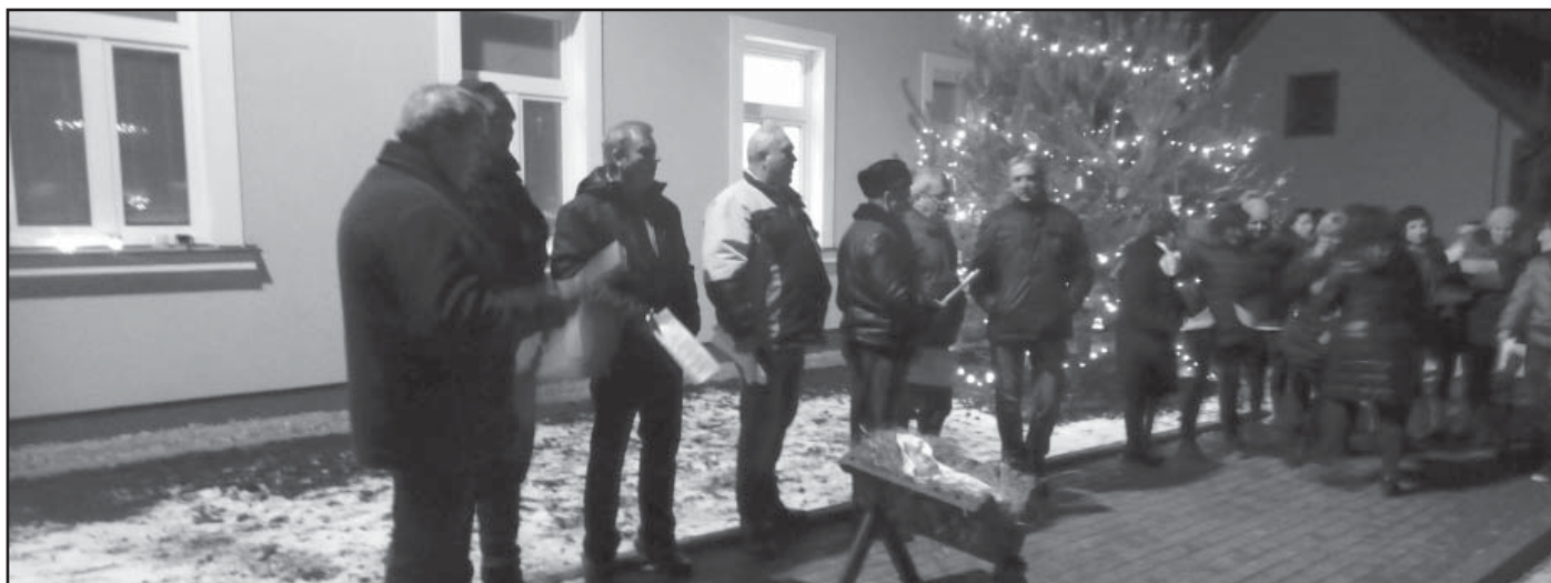
Představily se sbory místních mužádků i žen