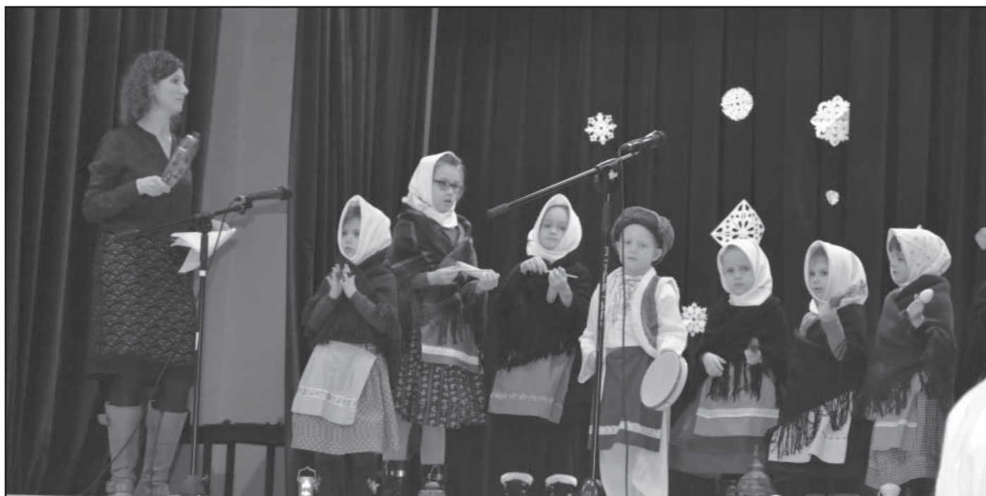
Folklórní soubor Lohovecké děti