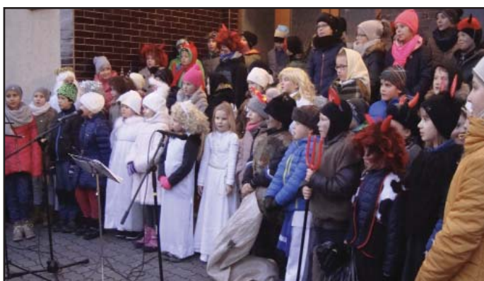
Mikulášské koledování žáků ZŠ