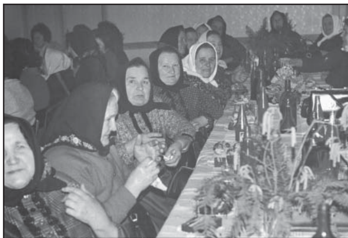
Výroční schůze JZD 80. léta