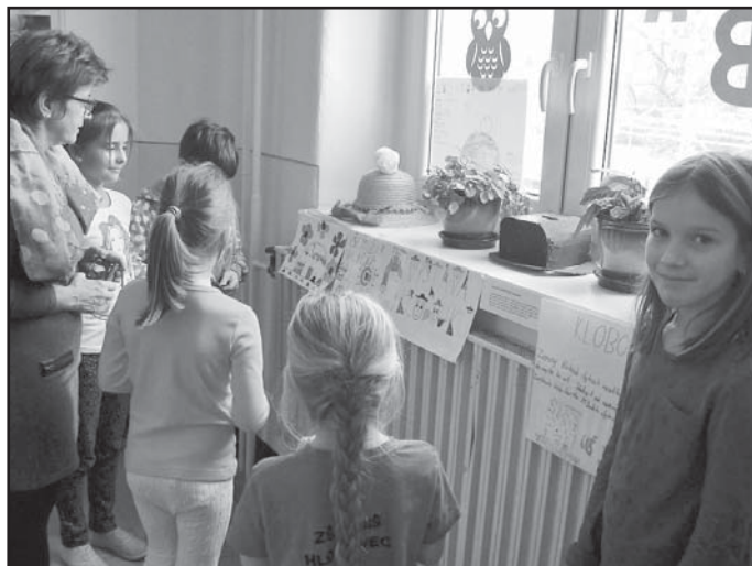
Chytré klobouky jsou objevem dívek ze 4. a 5. třídy