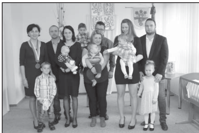
Vítání občánků, 1. skupina dětí a rodičů.