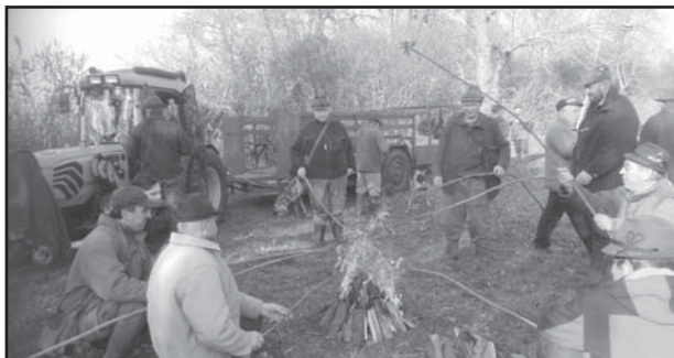
Svačina na honu