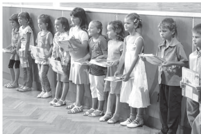
Tak to jsou oni, desítka nových hlohoveckých prvňáčků.

Uteklo to jako voda a za dlouhými letními prázdninami se zavřela vrátka. Všechny prázdniny jednou končí a s odchodem těch letních je na čase vytáhnout školní aktovky, pouzdra a začít se zase pilně a svědomitě učit.