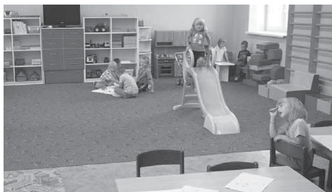
Třída Sluníček našla dočasné útočiště v tělocvičně základní školy.