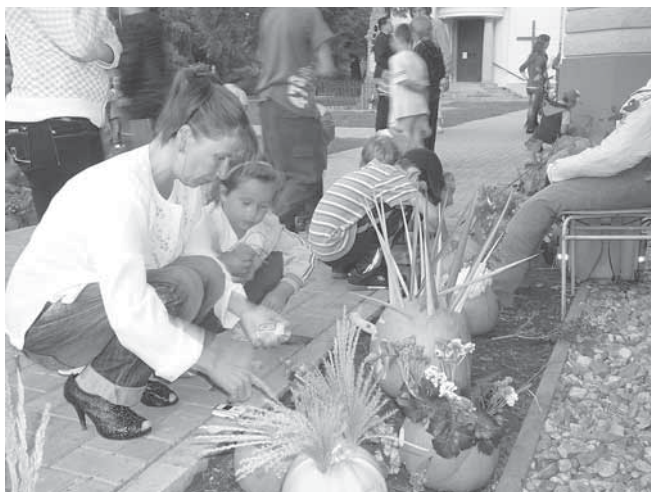
Úderem 19. hodiny začalo večerní zapalování dýní.

Kamarádký školní rok je na samém začátku, přesto už máme