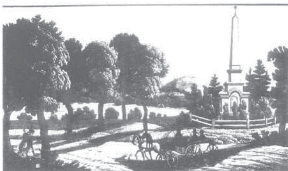
A vypadal takto kolem roku 1820: