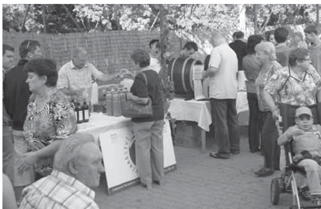
Hlohovecký burčák šel na dračku.