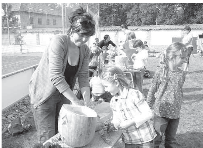
Vyřezávání a zdobení dýní si nenechaly ujít ani děti ze školy se svými rodiči.

za sebou první akce a projekty jako je výuka na dopravním hřišti, zahájení plaveckého výcviku v krytém bazénu a hlavně podzimní dyňování. Společného vyřezávání a tvoření se zúčastnili všichni školáci i děti z mateřské školy se svými rodiči. Večerní zapalování světylek před budovou školy pak bylo pěknou tečkou za touto společnou a příjemnou akcí.