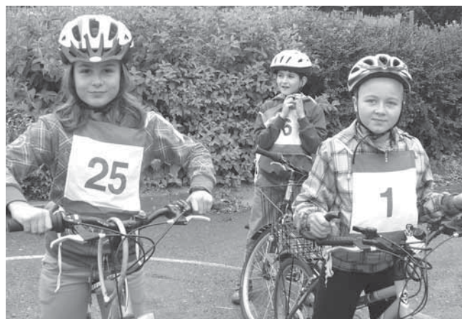
Dobrého kamaráda poznáš i při dopravě na kole.