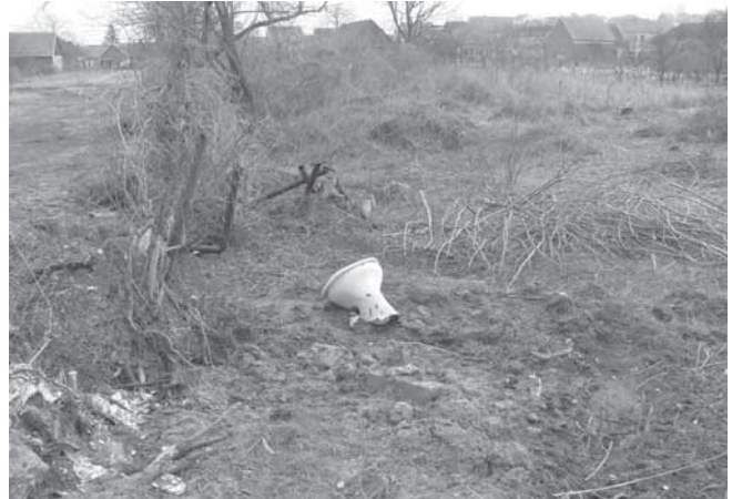
Taková zákoutí v obci přece nechceme?!