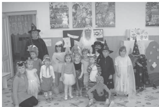
Co říkáte, slušelo nám to?