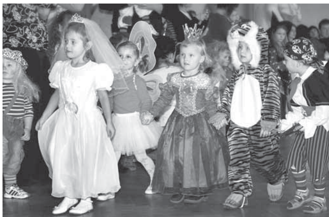
Na školním maškarním bále bylo opravdu na co koukat.