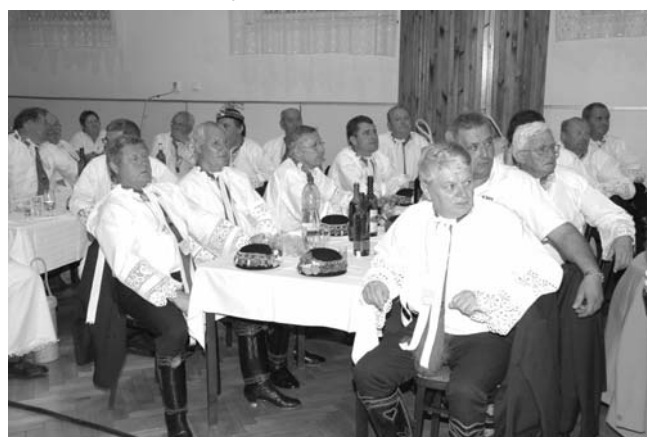
Vystoupení hlohoveckých mužáků pozorně sledovali i členové ostatních pěveckých souborů.