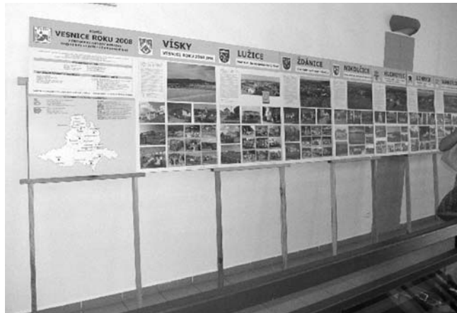
Prezentace vítězných obcí soutěže Vesnice roku na Zemi živitelce v Českých Budějovicích.

Poslední vystoupení v rámci soutěže se uskutečnilo 17. září v Praze na Ministerstvu zemědělství. Zde se před porotou předvedli vítězové Oranžových stuh z dvanácti krajů republiky. Paní starostka měla na prezentaci Hlohovce pomocí PowerPointu pouhých deset minut času, to ale stačilo na obsazení krásné páté pozice v rámci celé republiky. -IG-