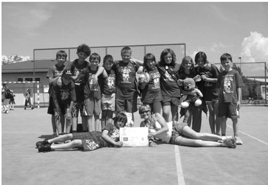
Foto našich borců z družstva vybíjené.