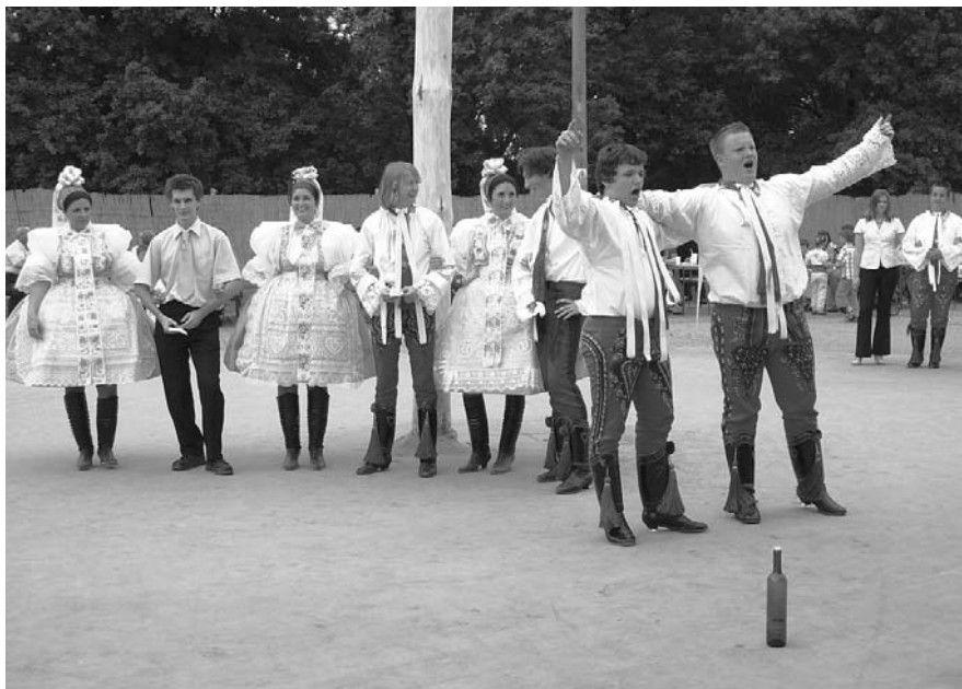
Letošní hodky navštívilo velké množství přespolních.