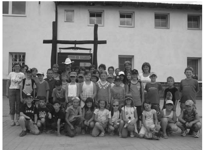
Účastníci letošní školy v přírodě v Rokycanech.