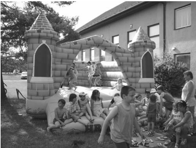
Jednou z vítaných atrakcí, kterou PETRKLÍČ dětem k jejich svátku přinesl, byl skákací hrad.