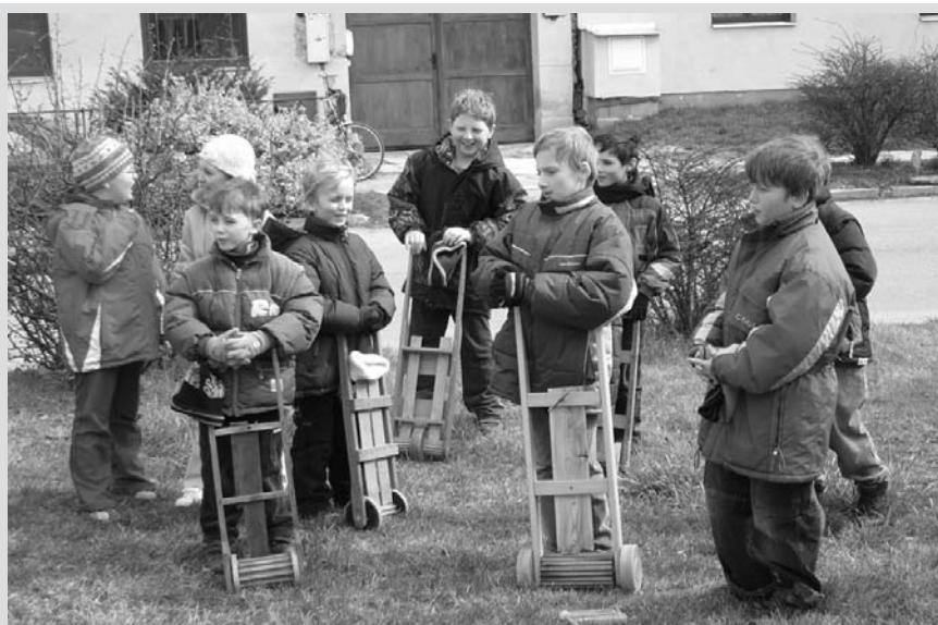
I přes chladné počasí se malí hrkači o letošních Velikonocích scházeli poctivě. Na fotografii při zastavení u křížku v Dědině.