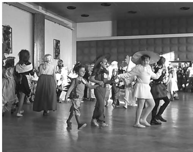
Návštěvníci lesního bálu