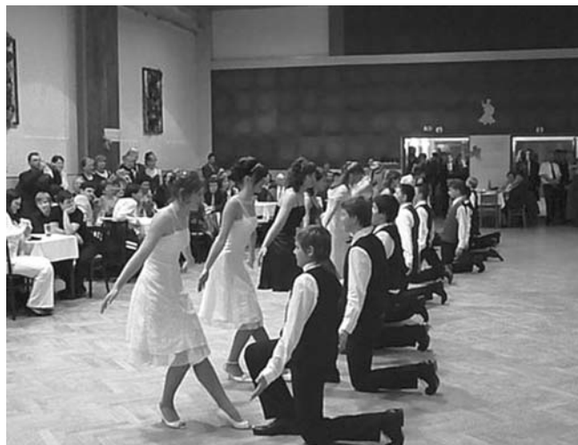
Polonéza školního plesu